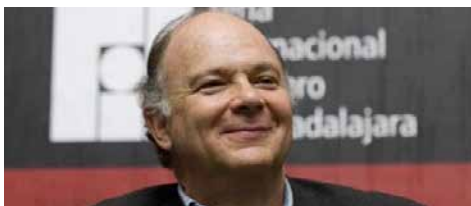
Enrique Krauze.

En 1999 Enrique Krauze fundó Letras Libres , publicación que recibió en 2014 el Premio Nacional