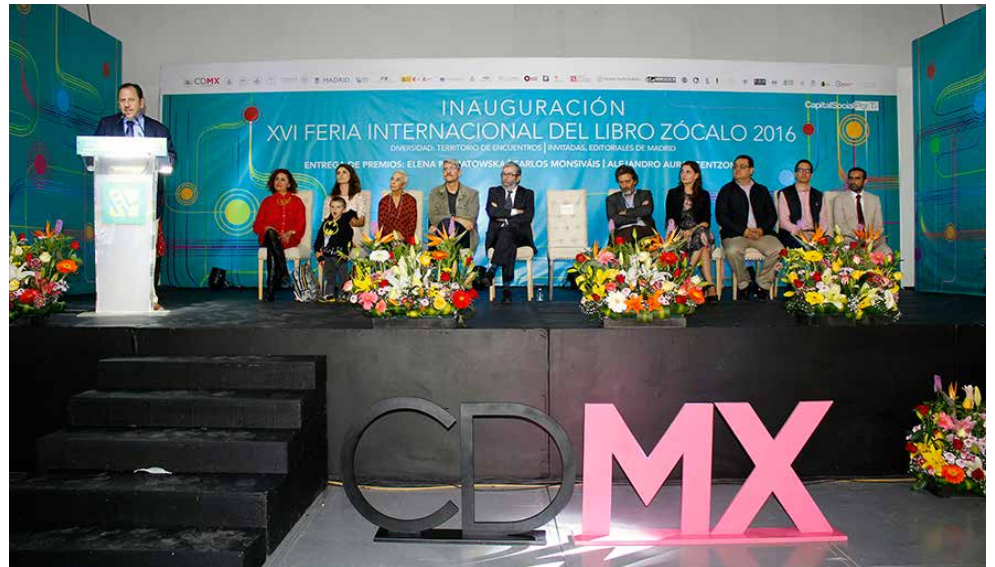
El secretario de Cultura de la Ciudad de México inauguró la FIL Zócalo 2016.