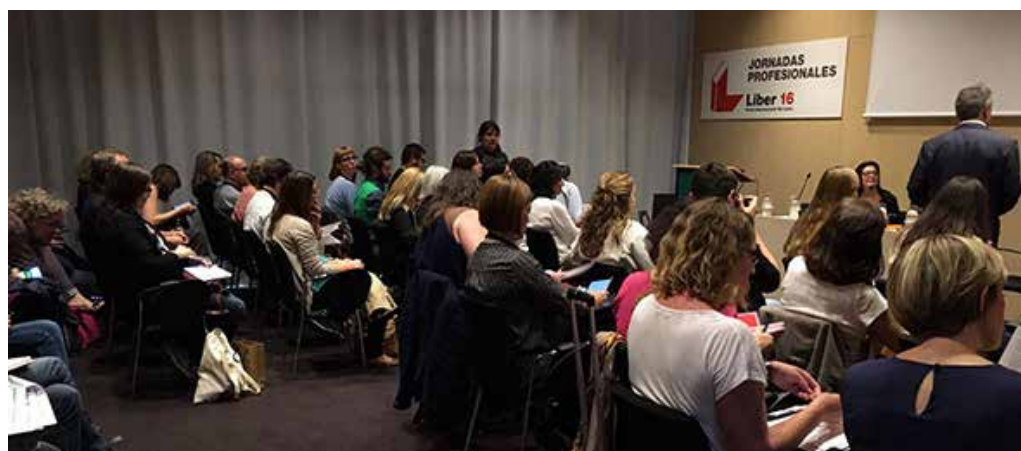
Jornadas profesionales Liber 16.

El objetivo de la "Declaración de Barcelona" es elevarla a la próxima Cumbre de Jefes de Estado y de Gobierno Iberoamericanos para que asuman el compromiso de poner en marcha un plan de acción que fortalezca el libro y la lectura en coherencia con los objetivos educativos planteados hasta el 2020. En concreto, el Grupo Iberoamericano de Editores