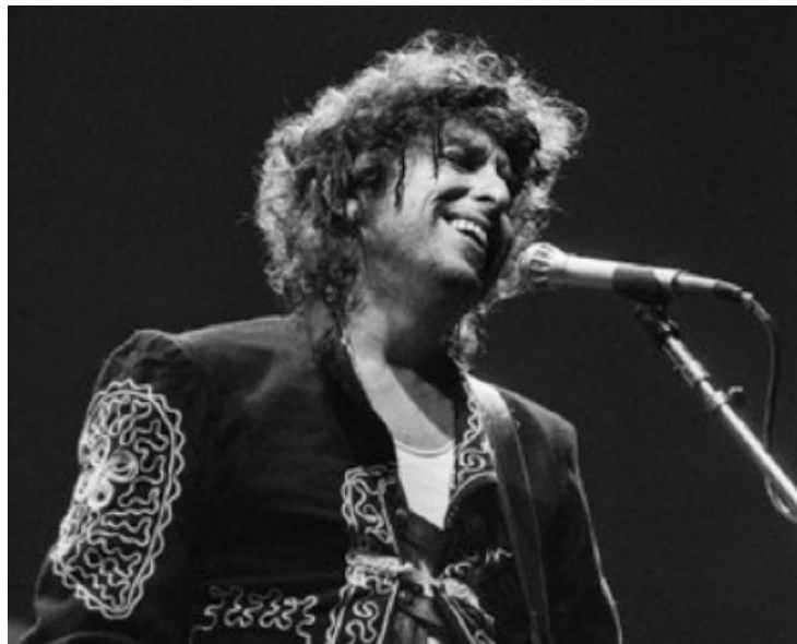
Dylan tocando en París, en 1987.

* Con información de Sewell Chan / The New York Times